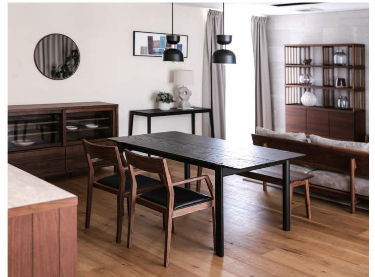
LAITON ダイニングテーブル W180×D90 WALNUT ¥410,000